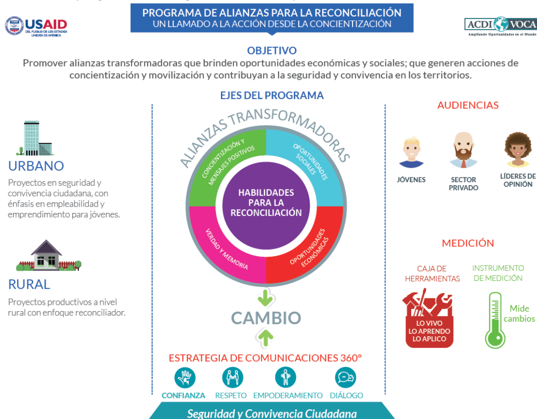
Gráfico 1: Enfoque general del Programa de Alianzas para la Reconciliación

Como se muestra en el Gráfico 1, la intervención del Programa en los municipios de cobertura (ver sección 1.1 MUNICIPIOS FOCALIZADOS), busca que, a través de las alianzas apoyadas, se integren acciones de los diferentes componentes mencionados, articulando iniciativas que aborden simultáneamente la promoción de oportunidades económicas y sociales; ejercicios de verdad y memoria; acciones de concientización; el fortalecimiento de las relaciones de convivencia, el cambio e actitudes en torno a la legalidad, y el fortalecimiento de habilidades para trabajar en pro de la reconciliación.